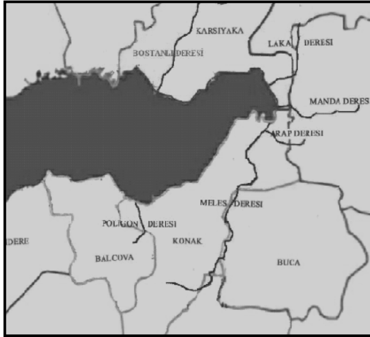
Şekil 1. İzmir Kenti araştırma alanı akarsuları haritası (Anonim, 2002)

Araştırma yöntemi; veri toplama, birim mekanların oluşturulması, arazi gözlem ve değerlendirme formlarının oluşturulması ve doldurulması, etki – etkileyen tablolarının oluşturulması ve değerlendirme olmak üzere beş aşamada ele alınmıştır.