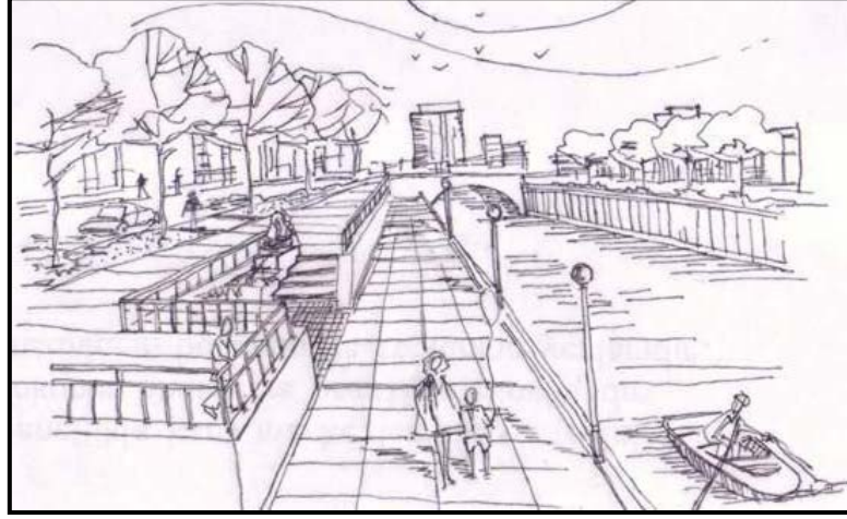
Şekil 3. Laka Deresi 2. birim mekanın geliştirilmesine yönelik bir öneri