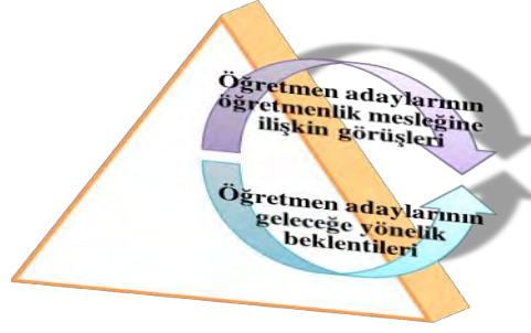
Şekil 1. Öğretmen adaylarının görüşlerinin değerlendirilmesi