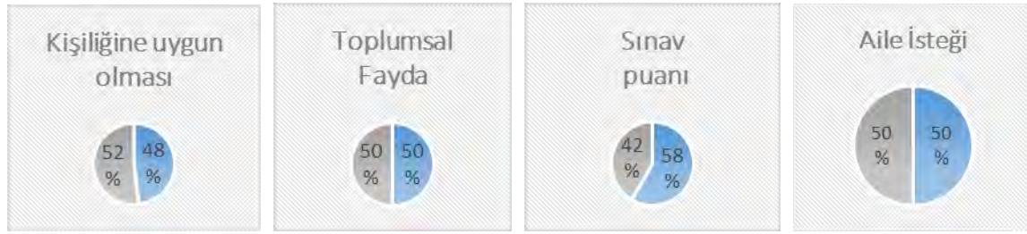
Şekil 3. Öğretmen adaylarının öğretmenlik mesleğini seçme nedenleri

Şekil 3’de oransal olarak değerlendirildiğinde; kız öğretmen adaylarının öncelikle kişilik özelliklerine uygun olması sebebiyle, öğretmenlik mesleğini tercih ettiği (% 52), toplumsal fayda (%50) ve aile isteğini (%50) ikinci planda tuttukları ve son olarak sınav puanı yeterli olduğu için (%42) öğretmenlik programına kayıt olmayı tercih ettikleri anlaşılmaktadır. Erkek öğretmen adaylarının da, toplumsal fayda (%50) ve aile isteğini (%50) eşit oranda değerlendirdiği, ancak daha çok sınav puanının yetmesinin (%58) sebebiyle öğretmenlik programına kayıt yaptırdığı anlaşılmaktadır. Kızlarla kıyaslandığında erkek öğretmen (%48) adaylarının kişiliğine uygun olmasını öncelikli değerlendirmede anlaşılmaktadır. Aşağıda bazı öğretmen adaylarının bu konuda yaptıkları açıklamalardan alıntılar sunulmuştur.