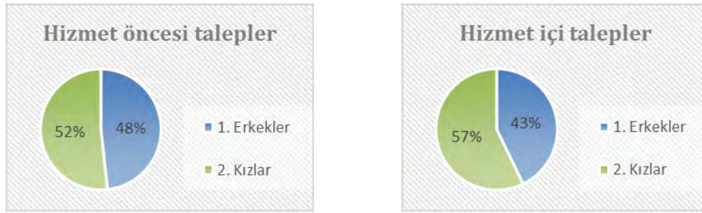
Şekil 4. Öğretmen adaylarının hizmet öncesi ve hizmet sonrası talepleri

Ancak oransal büyüklüklerine bakıldığında sonuçlar; kız öğretmen adaylarının (hizmet % 52, göreve başladıktan sonra:%57); erkek öğretmen adaylarına (hizmet öncesi: %48 ve göreve başladıktan sonra:% 43) kıyasla daha fazla beklentiler içinde olduğu görülmektedir. Bununla birlikte cinsiyetler kendi içinde değerlendirildiğinde erkek öğretmen adaylarının (%48) göreve başlamadan önce; kız öğretmen adaylarının da göreve başladıktan sonra (%57) taleplerinin daha yüksek olduğu anlaşılmaktadır (Şekil 4).