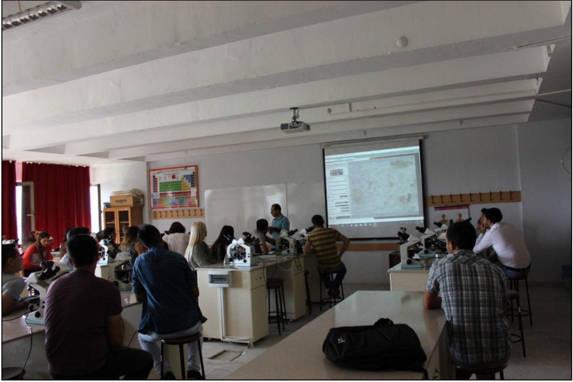
Fotođraf 2. Iřık mikroskobunda epifitik alg ve fitoplankton incelenmesi ve sayımı